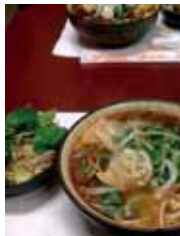
Bun Bo Hue

Se puede decir que la fuente de ingredientes para los platos en Vietnam es extremadamente abundante, sin embargo, también se debe reafirmar que los vietnamitas también son muy cuidadosos al usarlos y combinarlos (por ejemplo, operando la filosofía de Yin y Yang).