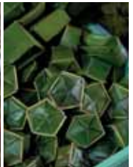
Biscocho de phu thê